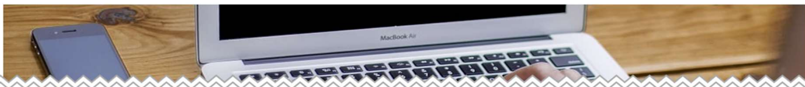
受講者画面の確認