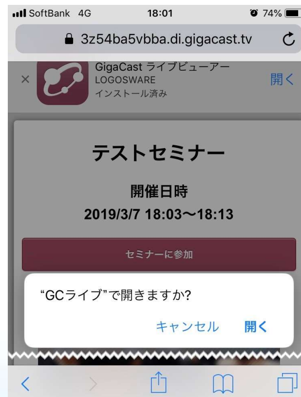
スマートフォン画面